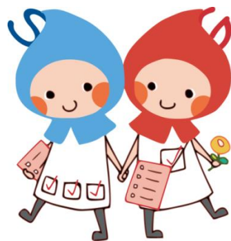
滋賀の健康づくりキャラクター しがのハグ&クミ