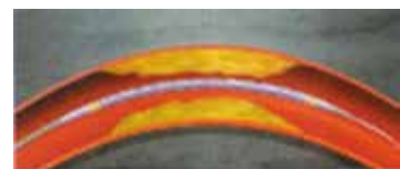
①狭いところにカテーテルを挿入