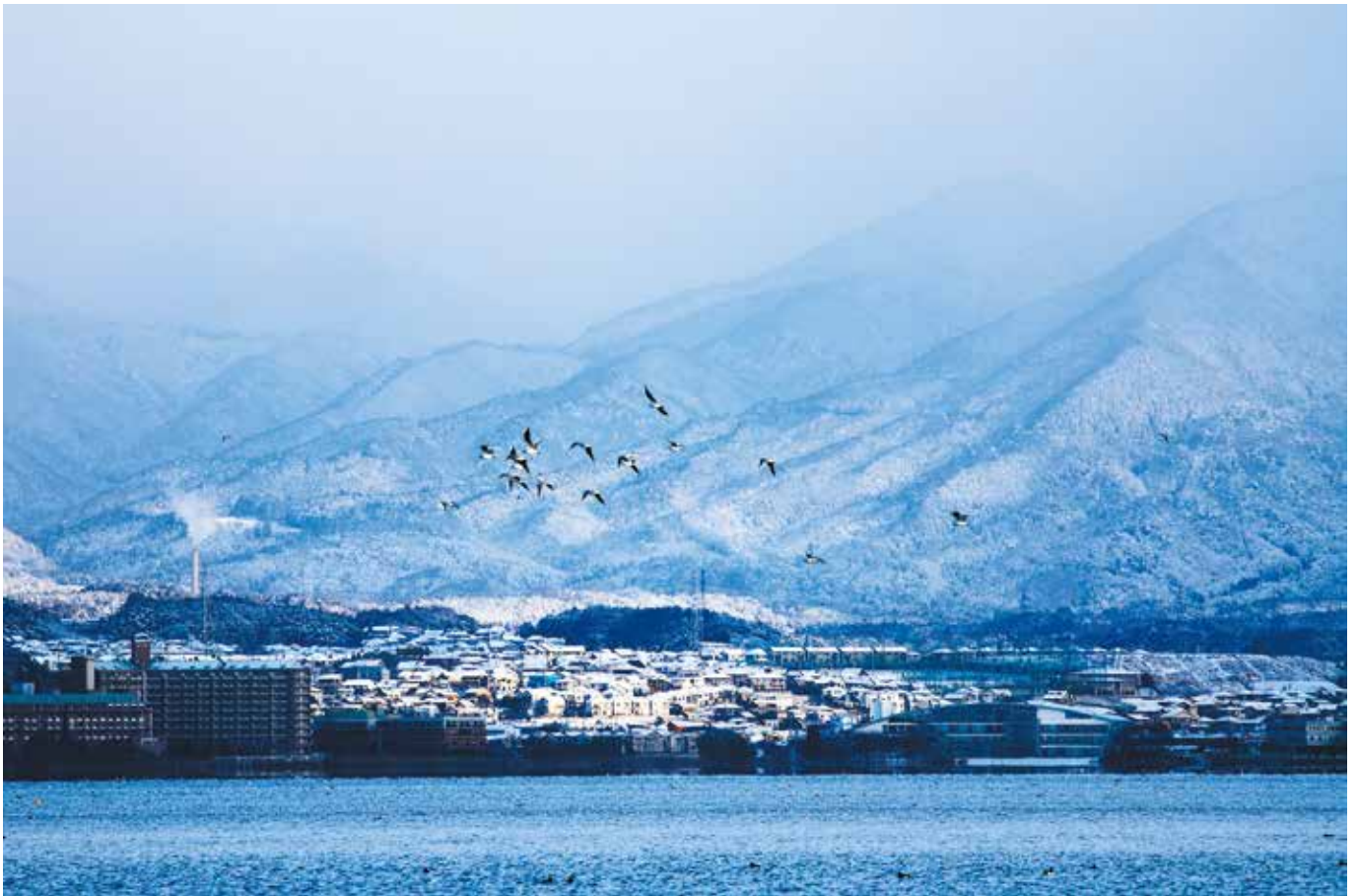
草津市より琵琶湖西岸を望む

● 患者さんをはじめ、地域のみなさまと済生会滋賀県病院とをつなぐ“かけはし”として、心温まる医療への思いを込めております。