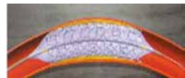
②ステントを血管内に留置